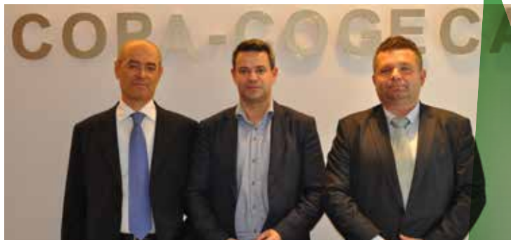
VBT algemeen secretaris gekozen als voorzitter Werkgroep Groenten en Fruit COPA-COGECA