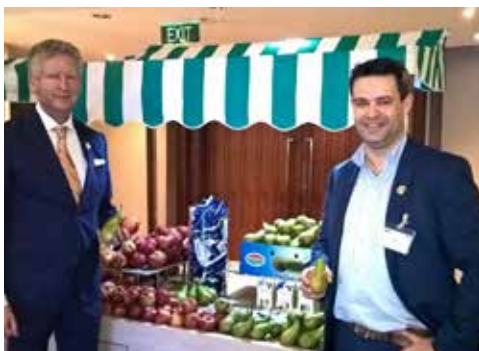
Prinselijke economische missie Indonesië