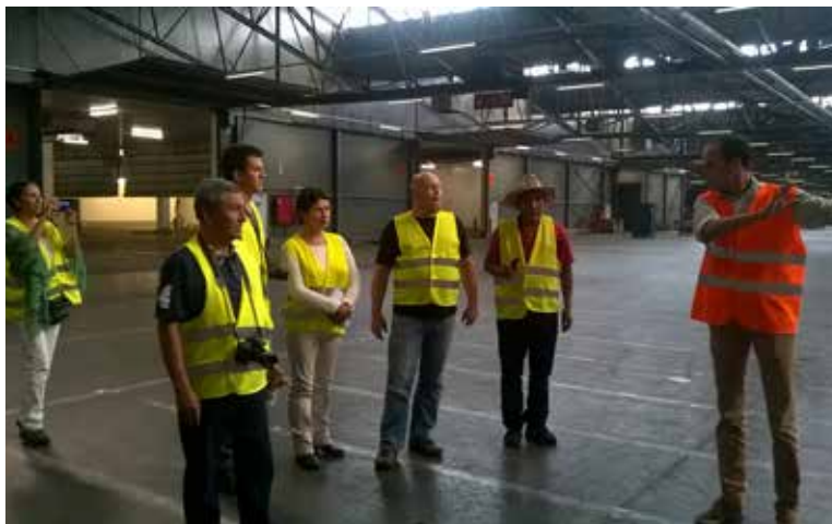
Uitwisselingsreis ANPE (Peru) en PACAT (Ecuador)

Het collectieve karakter van Responsibly Fresh blijft uniek en belangrijk. Door met de hele sector samen duurzaam te ontwikkelen heeft het project een belangrijke impact. Met de verschillende inspanningen neemt de sector zijn verantwoordelijkheid voor de verduurzaming van de agro-voedingsketen. De inspanningen worden via het keurmerk Responsibly Fresh gecommuniceerd aan de volgende schakels in de keten. Responsibly Fresh is zo een herkenningsteken voor