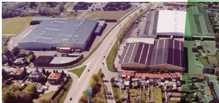
Belgische Fruitveiling (BFV)