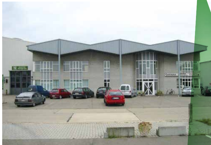
Limburgse Tuinbouwveiling (LTV)

In de zomer van 2015 ontving het VBT, via het FAVV en Freshfel, de eerste berichten van een nieuwe Indonesische wetgeving, met impact op de invoer van producten van plantaardige oorsprong, waaronder groenten en fruit, vanaf 17 februari 2016. Vanaf dan zou enkel ingevoerd kunnen worden door landen die hun dossier ingediend en/of goedgekeurd gekregen hebben. Indonesië voorziet hierbij twee alternatieven. Enerzijds, de Country Recognition Agreement waarbij een uitgebreid dossier dient opgesteld te worden door de verantwoordelijke overheidsdienst van het uitvoerend land en vervolgens dient goedgekeurd te worden door de Indonesische overheid, al dan niet na een inspectie ter plaatse. Deze optie zal toegang geven tot de Tanjung Priok haven van Jakarta. Anderzijds, de Laboratory Registration System dat eveneens een uitgebreid en door Indonesië goed te keuren dossier oplegt, waarbij