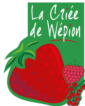
La Criée de Wépion