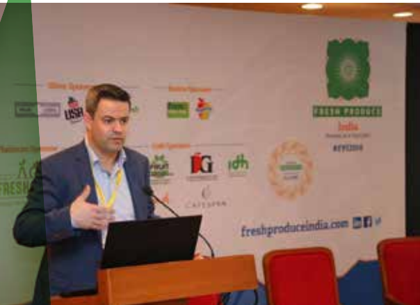
Fresh Produce Mumbai

Attraction Madrid), India (Fresh Produce Mumbai), de VS (Fresh Summit PMA Orlando) en de VAE (WOP Dubai). Er vond ook een contactdag plaats in Bulgarije (Sofia) waarbij Belgische exporteurs en veilingen de kans kregen om lokale importeurs en aankopers te ontmoeten. Daarnaast wordt gefocust op pr-manifestaties, mailings en imago-opbouw via de vakpers.