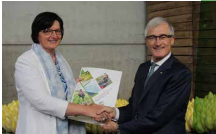
Overhandiging tweede duurzaamheidsrapport Responsibly Fresh aan Vlaams minister-president Geert Bourgeois