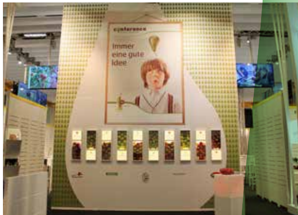
Promotiecampagne Conference Fruit Logistica Berlin

Ook in 2016 voerden de Belgische groenteveilingen verenigd onder Lava, in overleg met de VLAM en het VBT, verder promotie voor het kwaliteitslabel Flandria. De nieuwe campagne 'Met hart en ziel voor onze stiel. Dat proef je.' zet het harde werk van de Flandria-telers centraal. Deze campagne uitte zich onder meer in nationale radiospots, nieuwe websites, testimonials van Flandria-telers, advertenties in vakbladen en kookdemonstraties in winkelketens. De belangrijkste doelstelling is om Flandria te promoten als keurmerk bij consumenten en professionals.