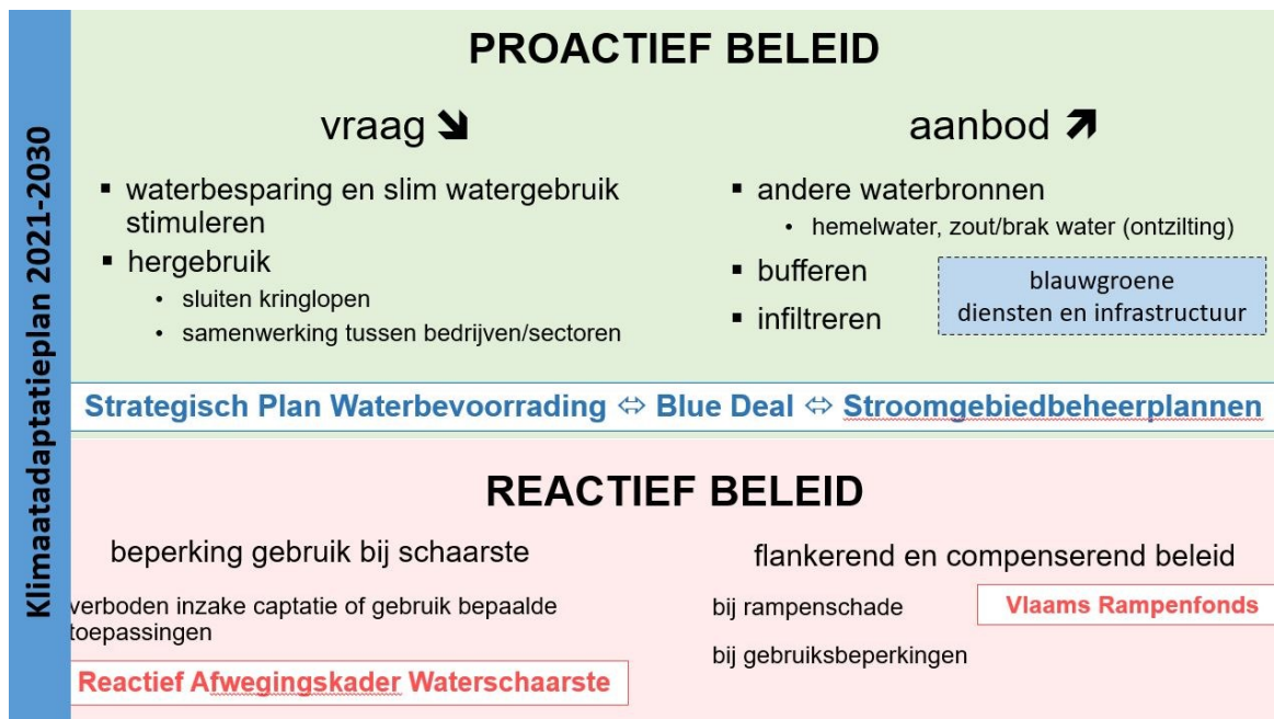
Figuur 2 Relevante beleidsplannen in het kader van het Vlaams Waterschaarste- en Droogtebeleid na 2021