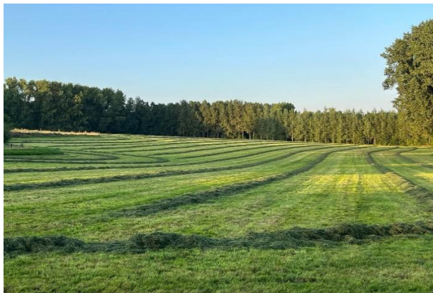
Weilanden omgeven door bomen beheerd door landbouwers

Nochtans, volgens natuurlandbouw zou er op “korte termijn” niets veranderen voor de landbouwers en paardenhouders en kunnen zij deze gronden verder beheren zoals vandaag. De vraag is; waarom hebben ze deze dan mee ingekleurd? Als er dan toch niets zou veranderen hoeven ze al die landbouwgronden toch niet mee te nemen in dat globaal kader. “Deze valse woorden hebben ze ons 20-30 jaar geleden ook al verteld met de natura 2000 gebieden en de VEN-gebieden, ook hier dragen we vandaag nog de gevolgen van... In onze regio zie je veel graslanden omgeven door bomen en bossen, vandaag worden wij als “groene” landbouwers gestraft net doordat we zo goed voor onze natuur zorgen.