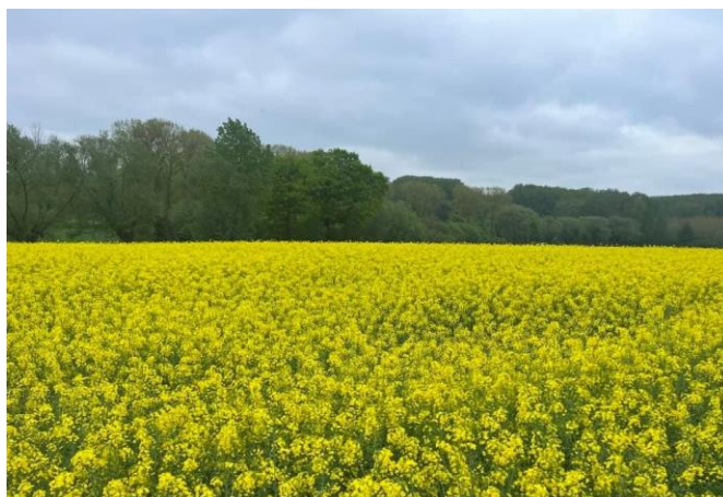
Goed akkerland zoals dit perceel koolzaad van '23 werd ingekleurd

Als we kijken naar de ecologische langetermijnvisie in het aangevraagde beheerplan is het de bedoeling om van de 578ha (waarvan 70% landbouwgebied) 310ha gesloten landschap bos en 88ha halfopen landschap bos te verwezenlijken, daarnaast 180ha halfopen landschap graslanden, beheert door natuurlandbouw met 0 bemesting, geen gewasbeschermingsmiddelen, geen toerisme,... Dat komt ongeveer neer op 300ha extra bosuitbreiding! Dus voor natuurlandbouw is het doel dat ze die volledige 578ha in eigen beheer hebben binnen de 50 a 100 jaar. Naast agrarische graslanden werden ook goede akkerlanden ingekleurd, percelen waar vorig jaar nog aardappelen, tarwe en koolzaad werden geteeld!