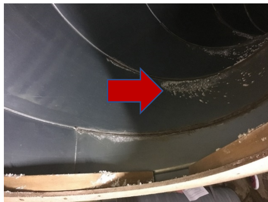
Figuur 5 & 6 Luchtcoolapparatuur en bijbehorende kanalen voor opslag in kisten