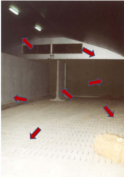
Figuur 2 - Plaatsen in de bewaarloods waar CIPC-contaminatie gemakkelijk kan worden aangetoond