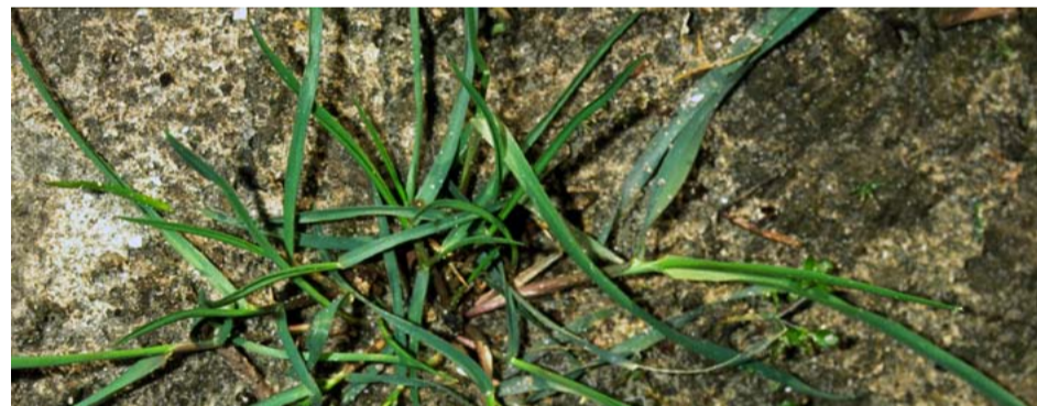
Duist (foto: ing. H. Glas).

Bij laatkiemende eenjarige grassen, zoals hanenpoot, is een afdoende bestrijding te behalen door, in het lagedoseringensysteem Dual Gold of Frontier Optima toe te voegen of in plaats van metamitron te spuiten. Het is belangrijk om te spuiten voordat de grassen gekiemd zijn. In tabel 6 staan de milieubelastingspunten van de grassenmiddelen, bij twee humusgehalten en bij diverse doseringen.