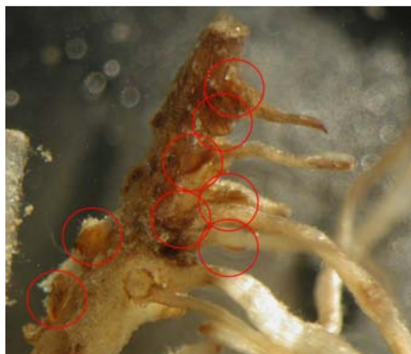
Bij een zeer zware aantasting van bietencystealtjes kunnen wortels afsterven. De gevormde cysten zijn roodomcirkeld.

De schade door wortelknobbelaaltjes ( Meloidogyne spp. ) in suikerbieten is meestal beperkt. Met bladrammenas wordt een snelle uitzieking bereikt met uitzondering van het noordelijk wortelknobbelaaltje ( M. hapla ). Door de opname van granen in de rotatie, kan schade door het noordelijk wortelknobbelaaltje worden voorkomen. Het gebruik van granulatoren is zelden rendabel in de bietenteelt. De schadadedrempel voor het maïswortelknobbelaaltje ( M. chitwoodi ) ligt op 500 larven per 100 ml grond. Bij het bedrieglijk maïswortelknobbelaaltje ( M. fallax ) is dat 2.500. Boven deze hoeveelheden kan het rendabel zijn om Vydate (15 kg/ha) toe te dienen. Het middel dient u als zaaivoorbehandeling toe te passen.