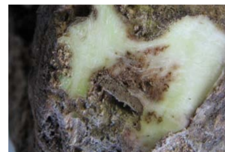
Bruine verkurte plekken net onder de schil in de kop van de biet veroorzaakt door stengelaaltjes.

Op de website www.aaltjesschema.nl vindt u altijd de meest actuele informatie over de verschillende soorten aaltjes. Naast algemene informatie kan ook een aaltjesschema gemaakt worden dat weergeeft in hoeverre gewassen schade ondervinden en aaltjessoorten vermeerderen.