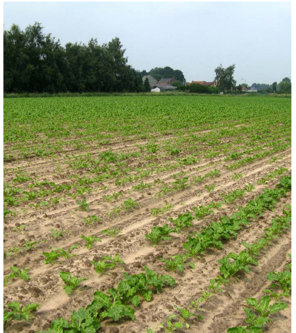
Plantwegval door aphanomyces in combinatie met een lage pH leidt tot een onregelmatig plantbestand.

Om te berekenen hoeveel kalkmeststof u per hectare nodig heeft om de pH op het gewenste niveau te brengen, kunt u de Betakwik-module 'Kalkbemesting' gebruiken. Deze vindt u op www.irs.nl .