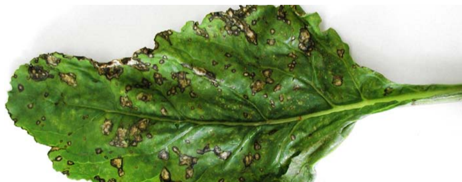
De onregelmatige bladvlekken die worden veroorzaakt door pseudomonas zijn niet te bestrijden.

In de loop van het seizoen komen, vaak na zware regen- of hagelbuien, nog andere bladziekten voor, zoals de schimmel alternaria en de bacterie pseudomonas. Bestrijding daarvan is niet mogelijk.