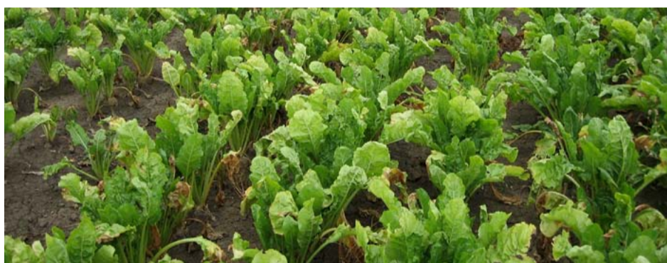
Afsterfen van de oudere bladeren veroorzaakt door verticillium. Voor het afsterfen is vaak eenzijdige verwelking van de bladeren te zien.

Belangrijk, en ook bekend uit andere gewassen, is dat de schade door verticillium versterkt kan worden door de aanwezigheid van aaltjes. De dichtheden van de bietencystealtjes zo laag mogelijk houden of zoveel mogelijk terugdringen is dus ook voor de Verticillium-aantasting heel belangrijk.