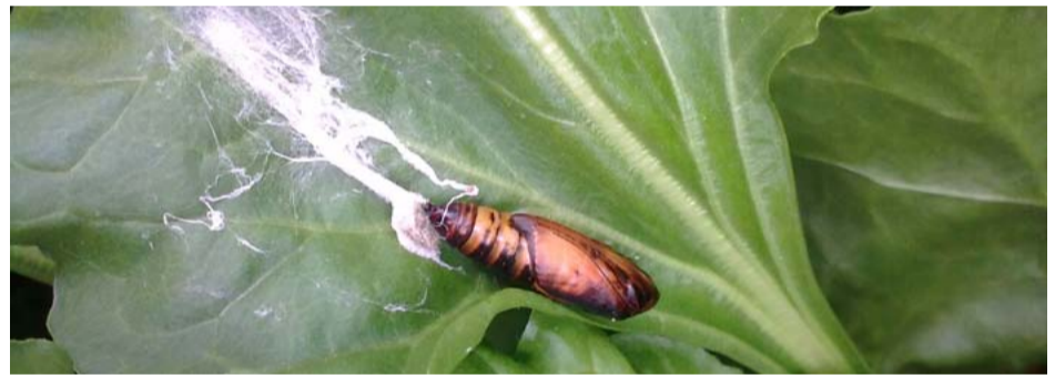
Pop van de rups van de gamma-uil. In dit stadium is het niet mogelijk om dit insect te bestrijden. Bestrijding is alleen mogelijk in het rupsenstadium.

In de zomer kunnen verschillende soorten rupsen aan de bladeren vreten. Bestrijding is pas nodig wanneer circa 30% van het bladoppervlak dreigt te worden weggevreten. Bestrijden kan met deltamethrin (diverse merken; 0,3 l/ha). Meer over rupsen kunt u lezen op pagina 12.