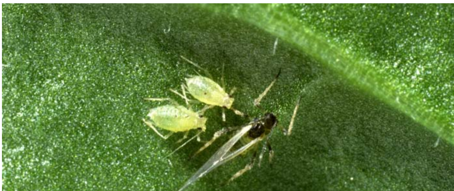
Een gevleugelde groene perzikbladluis samen met twee ongevleugelde jongen.