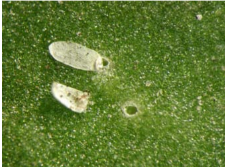
Lege eieren van de bietenvlieg (alleen zichtbaar met loep). De larve is reeds uit het ei gekropen en is dood, doordat hij aan de plant heeft gevreten afkomstig uit een zaadje dat behandeld is met insecticiden.

De bietenvlieg komt op alle grondsoorten voor. Het optreden per gebied en per perceel is vaak sterk verschillend. Meestal wordt weinig schade veroorzaakt, omdat bieten een belangrijk deel van het bladoppervlak kunnen missen. Een gewasbespuiting is alleen rendabel bij jonge bietenplanten wanneer de eerste mineergangen én gemiddeld de in de tabel vermelde aantallen gevulde eieren en/of larven per plant aanwezig zijn. Bij een gesloten gewas alleen als meer dan 30% van het bladoppervlak dreigt te worden weggevreten. De bietenvlieg legt cilindervormige eitjes op de onderzijde van de bladeren. Gevulde eieren vertonen een rasterstructuur en lege eieren vertonen een deukje. De larven die uit de eitjes komen, maken mineergangen tussen de oppervluiden van de bladeren. De bestrijding kan uitgevoerd worden met dimethoaat (diverse merken; 0,25 l/ha, maximaal één toepassing per jaar). Wanneer speciaal pillenzaad is uitgezaaid, is een bespuiting niet nodig.