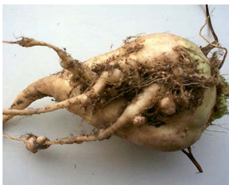
Grote en kleinere wortelknobbels veroorzaakt door het wortelknobbelaaltje ( Meloidogyne spp. ).