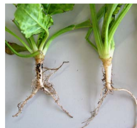
Afgeknot en vertakte wortels door Trichodorus similis .

veroorzaken. „Omdat veel gewassen voor deze vier soorten een verschillende waardplantstatus hebben, is het van belang om precies te weten om welk soort het gaat”, besluit Hoek.