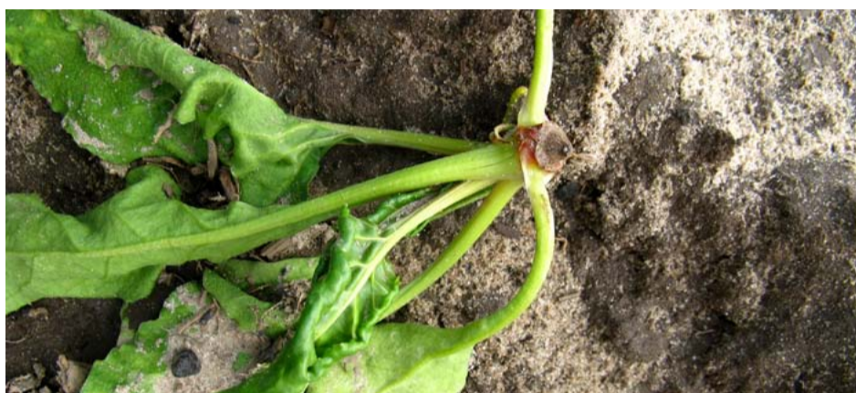
Afdraaier door hoge aantasting van aphanomyces. Tachigaren in het pillenzaad beschermt de kiemplant tegen aphanomyces.

Al het pillenzaad is behandeld met 8 gram TMTD (4 g thiram) en 21 gram Tachigaren (15 g hymexazool) per eenheid zaad. TMTD beschermt het zaad tegen zaadschimmels. Tachigaren geeft een goede bescherming in het kiemplantstadium tegen de bodemschimmel aphanomyces, die de zogenaamde afdraaiers veroorzaakt. Aphanomyces kan de bieten ook later in het seizoen aantasten. In de meeste gevallen levert dit geen schade van betekenis. Preventiemaatregelen zijn een optimale pH en een goede bodemstructuur. Zie ook 'Verhogen pH helpt tegen plantwegval' op pagina 12. Beide aan het pillenzaad toegevoegde fungiciden geven een bescherming tegen de bodemschimmel pythium. Extra beschermingsmaatregelen tegen pythium zijn niet nodig en niet mogelijk.