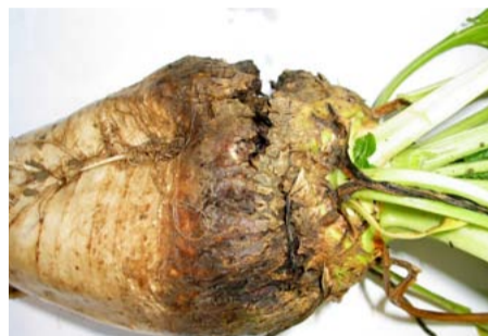
Koprot veroorzaakt door stengelaaltjes.

Dit aaltje ( Ditylenchus dipsaci ) komt incidenteel voor op zavel- en kleigronden. Het optreden is te herkennen aan necrotische vlekken in de kop, die later zwart worden. Een redelijke bescherming wordt verkregen door de toepassing van Vydate (10 kg/ha). Het middel dient u als zaaivoorbehandeling toe te passen. Pas op voor het stengelaaltje in bieten na uien met kroef of bolbroek. Meer informatie hierover vindt u ook op pagina 2.