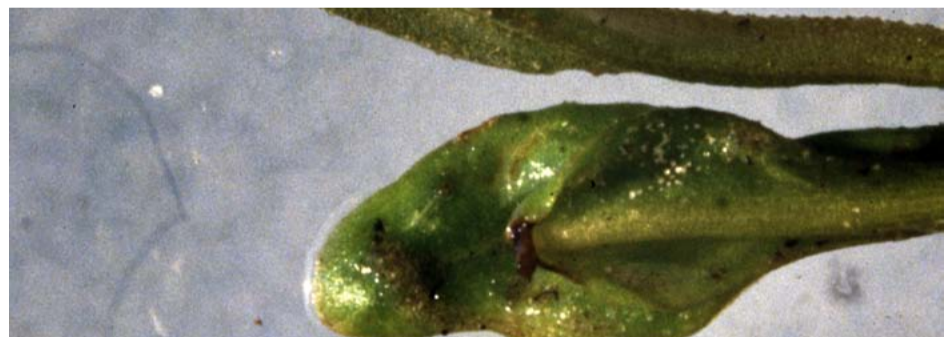
Naar buiten omgekrulde, misvormde en verdikte bladeren als gevolg van trips.

Tripsen, ook wel onweersbeestjes genoemd, komen alleen op kleihoudende gronden voor. Het optreden in het kiemblad- of in het twebladstadium van de bieten gebeurt bij schraal weer. Meestal blijft de schade beperkt, omdat na een weersomslag de aantasting ophoudt. Tripsen komen meer voor na vlas en erwten dan na andere voorvruchten. De aanwezigheid van tripsen kunt u vaststellen door bieten op de hand uit te kloppen. Voer bij veel tripsen een bespuiting uit met deltamethrin (diverse merken; 0,3 l/ha), Karate Zeon (0,05 l/ha) of Somicidin Super (0,2 l/ha). Speciaal pillenzaad heeft een beperkte werking.