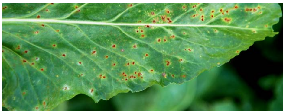
Roest treedt vaak pas op vanaf september, doordat de optimale ontwikkelingstemperatuur lager ligt dan die van cercospora.