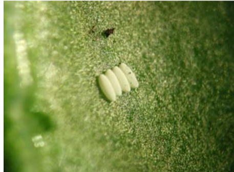
Eieren van de bietenvlieg met daarin nog levende larven (alleen zichtbaar met loep).