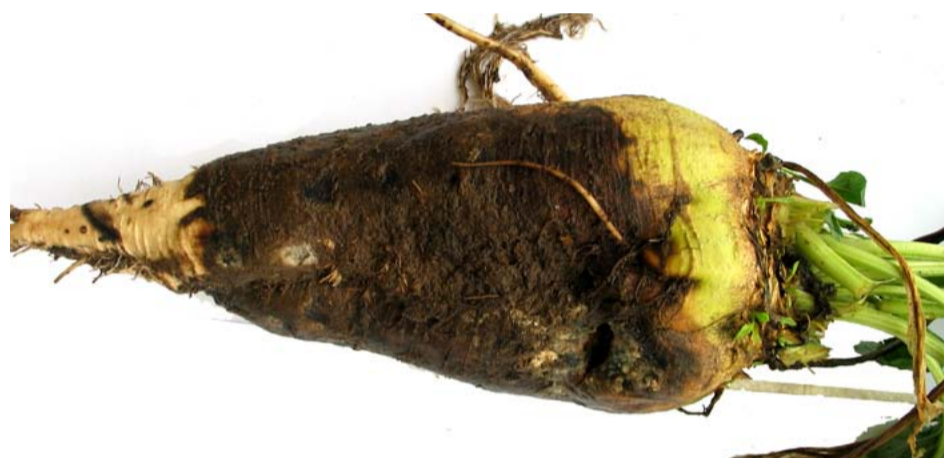
Aantasting door rhizoctonia. Dit begint met kleine zwarte vlekjes (1 cm) net onder het grondoppervlak en kan zich later uitbreiden.

Ook kunnen bij de oogst rotte bieten voorkomen. Zorg voor goede teeltomstandigheden door geen waardgewassen voor de bieten te telen en zorg voor een goede bodemstructuur. Streef in verband met het gevaar van schietervorming naar een vlotte veldopkomst. Rhizoctoniaresistente rassen zijn gevoeliger voor schieten dan enkel rhizomanieresistente rassen.