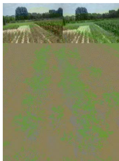
Essai non traité Louisa (6 juillet)