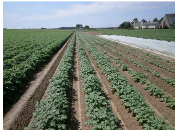
Variété Louisa chez un agriculteur partenaire